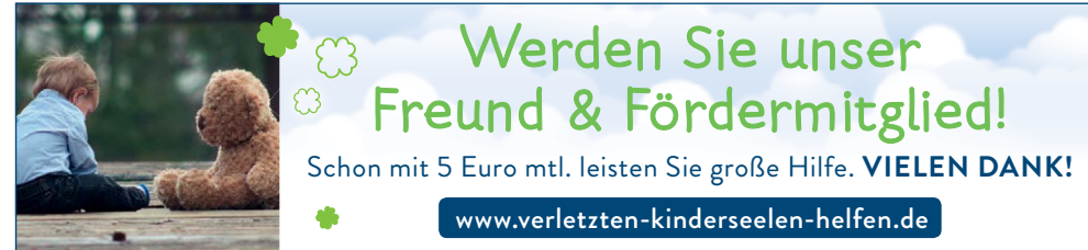
130x30 mm, Motiv Junge & Bär