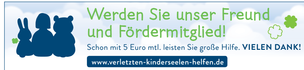
130x30 mm, Motiv Logo