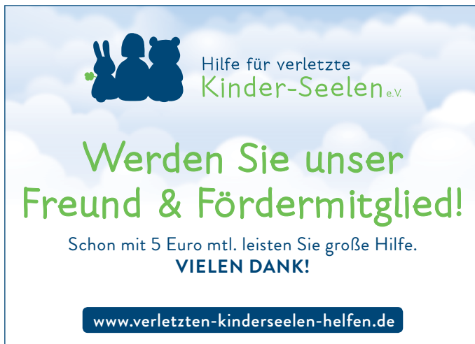
90x65 mm, Motiv Logo