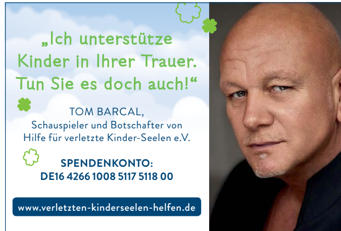
90x60 mm, Motiv Botschafter Barcal