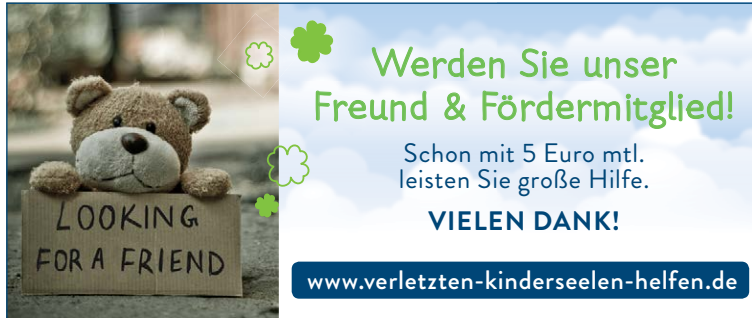
100x42 mm, Motiv Bär