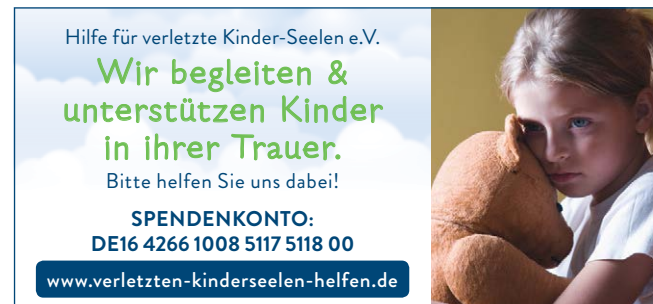
87x40 mm, Motiv Mädchen & Bär 01