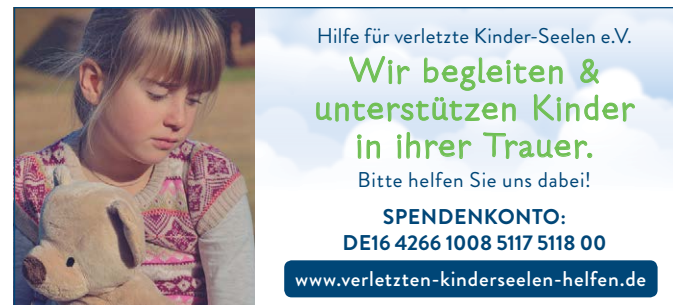
90x40 mm, Motiv Mädchen & Bär 02